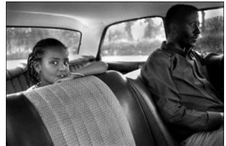
Etiopía

Nascuda a Moçambic i arrelada a Barcelona, porta a terme projectes culturals de sensibilització, especialment relacionats amb l'Àfrica dins les vessants de desenvolupament i interculturalitat. Amb el documental Expressions de l'Àfrica Negra a Barcelona pretén trencar amb estereotips sobre els residents africans al nostre país mitjançant les aportacions creatives de 12 artistes negroafricans i com interaccionen a l'escenari cultural de la ciutat.