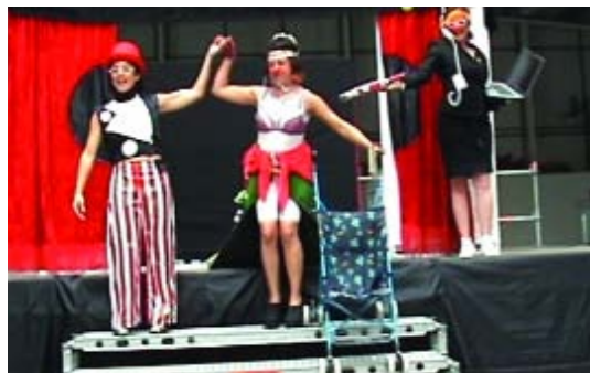
Agraïments: Itziar Castro, Mercè Espelleta, Ariadna Martí i Carme Poll

Català. 10 € taquilla 8 € atrapalo.com 5 € associacions 2x1 TR3S C